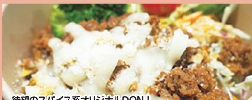
D キーマカレーDON 800円