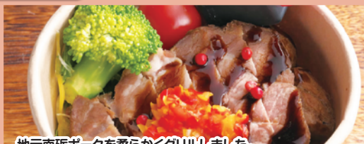
B 南砺ポークグリルDON 800円