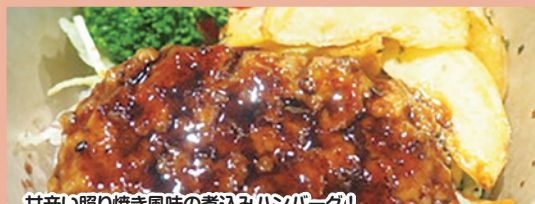
C 照り焼き風ハンバーグDON 800円