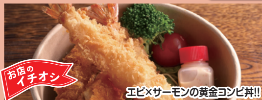
A エビとサーモンのフライDON 800円